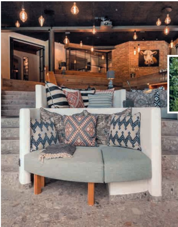
WOHLFÜHL-PLÄTZE ... zum Träumen und Entspannen gibt es drinnen und im großen Wellnessgarten

Das 5-Sterne-Hotel liegt in einem Naturpark und nutzt für sein Thermal-Spa mit Saunen und Dampfbädern die einzige Thermalquelle der Balearen. Weitere Highlights: der Infinity-Pool mit Terrasse, vier Jacuzzis im Garten, die mit Original-Werken zeitgenössischer Künstler ausgestattet sind. Mehr Infos: fontantahotel.com