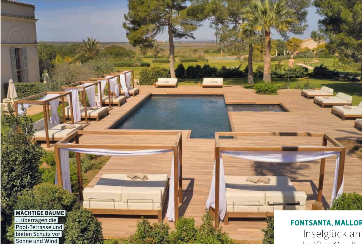
MÄCHTIGE BÄUME ... überragen die Pool-Terrasse und bieten Schutz vor Sonne und Wind