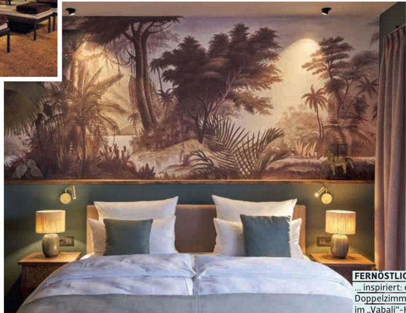
FERNÖSTLICH ... inspiriert: ein Doppelzimmer im „Vabali“-Hotel

Warum ewig im Flieger sitzen, wenn man den Zauber Bali quasi um die Ecke erleben kann? In Glinde unweit von Hamburg liegt das „Vabali Spa“, eine 36.000 m 2 große Wellnessoase mit Hotel. Das Angebot in 13 Saunen umfasst klassische und Ayurveda-Massagen, Peeling- und Aufguss-Zeremonien, die gesamte Gestaltung in Meeres- und Erdtönen, mit Holz, Säulen und Buddha-Figuren freut Wellness- und Asia-Fans gleichermaßen. „Vabali“-Spas gibt es auch in Berlin und Düsseldorf. Mehr Infos: vabali.de